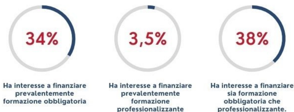
Figura 5 – Le esigenze formative delle aziende

Il 34% delle aziende intervistate ha interesse a finanziare prevalentemente formazione obbligatoria, il 3,5% quella professionalizzante mentre il 38% è interessata sia a formazione obbligatoria che professionalizzante.