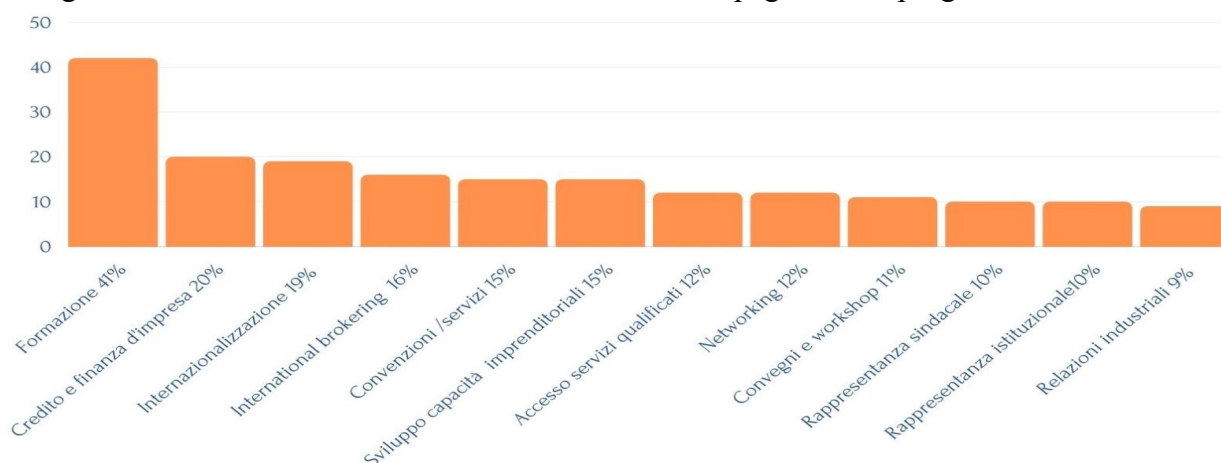
Figura 2 – Gli ambiti di interesse ai servizi

Anche in questo caso, è possibile considerare gli ambiti di interesse come espressione di un fabbisogno aziendale, e come tale necessita di essere accompagnato con progetti formativi.