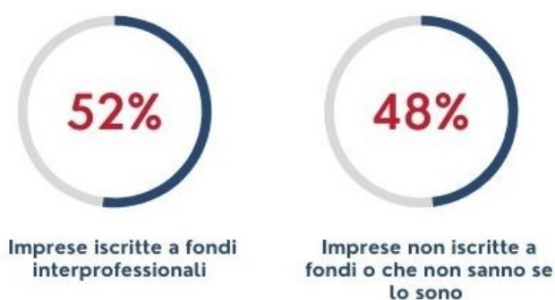
Figura 3 – I fondi interprofessionali

Il 52% dichiara di essere iscritta ad un fondo interprofessionale, mentre il restante 48% dichiara di non essere iscritto a fondi o di non saperlo.